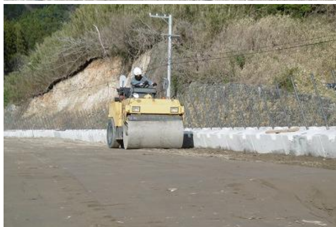
■ 転 圧