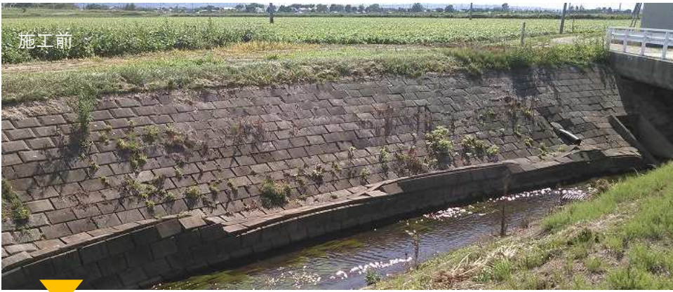
豊田排水路改修整備工事 (北海道池田町)