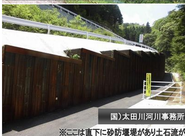
国)太田川河川事務所／城ヶ谷線(矢板MAW)