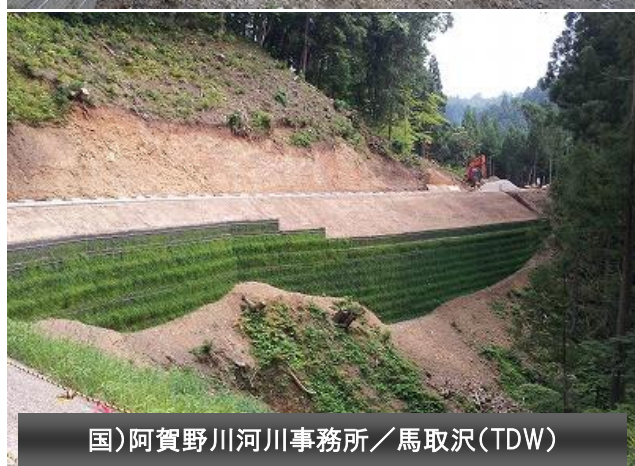
国)阿賀野川河川事務所／馬取沢(TDW)