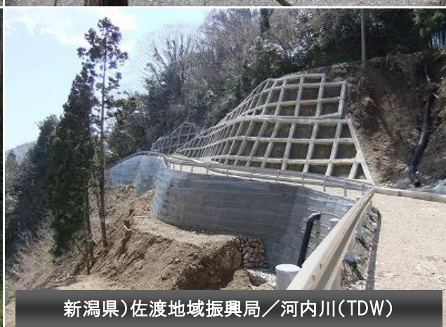
新潟県)佐渡地域振興局／河内川(TDW)