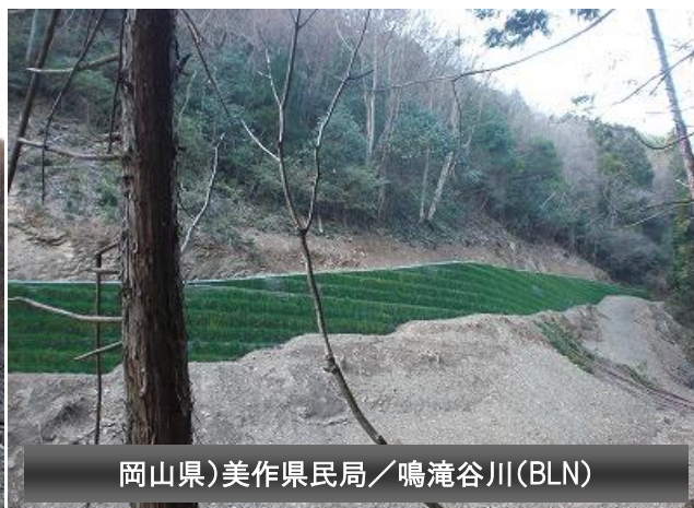
岡山県)美作県民局／鳴滝谷川(BLN)