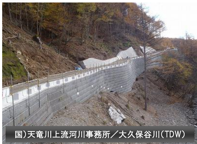
国)天竜川上流河川事務所／大久保谷川(TDW)