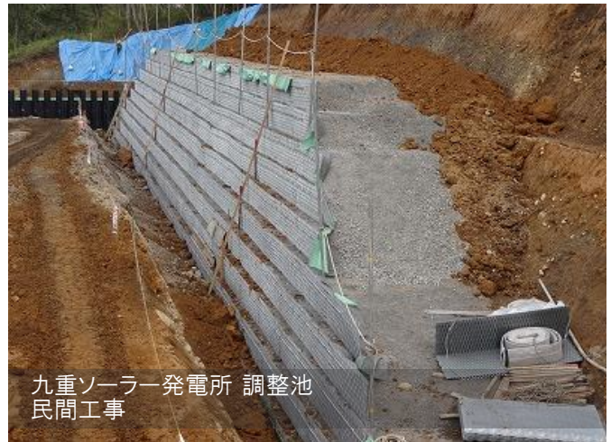
九重ソーラー発電所 調整池 民間工事