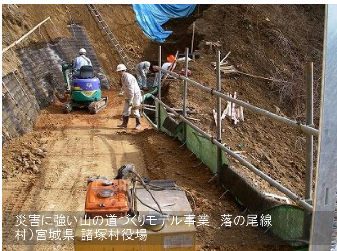
災害に強い山の道づくりモデル事業 落の尾線 村)宮城県 諸塚村役場