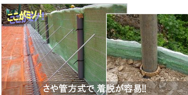
さや管方式で 着脱が容易!!