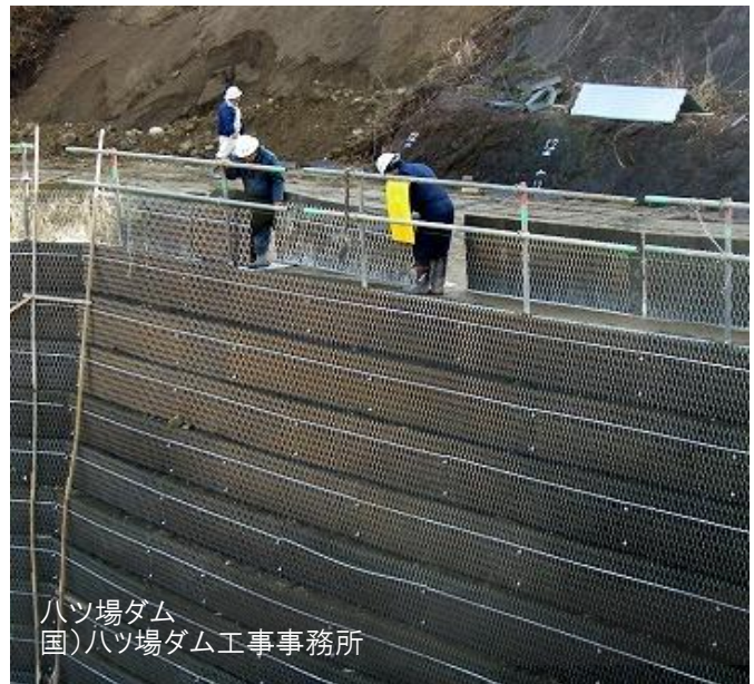
ハツ場ダム 国)ハツ場ダム工事事務所