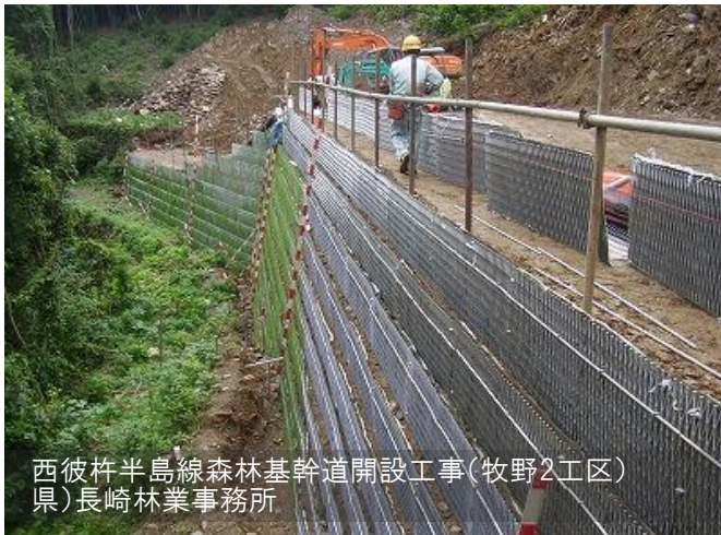
西彼杵半島線森林基幹道開設工事(牧野2工区) 県)長崎林業事務所