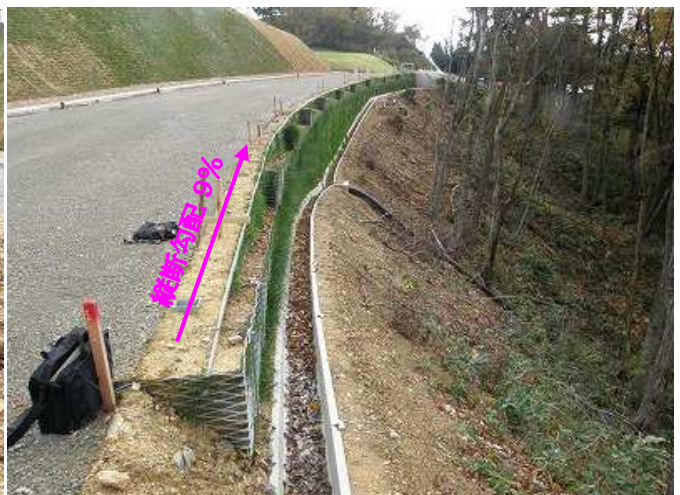
山形県庄内総合支庁/広域営農団地農道整備事業第3工区