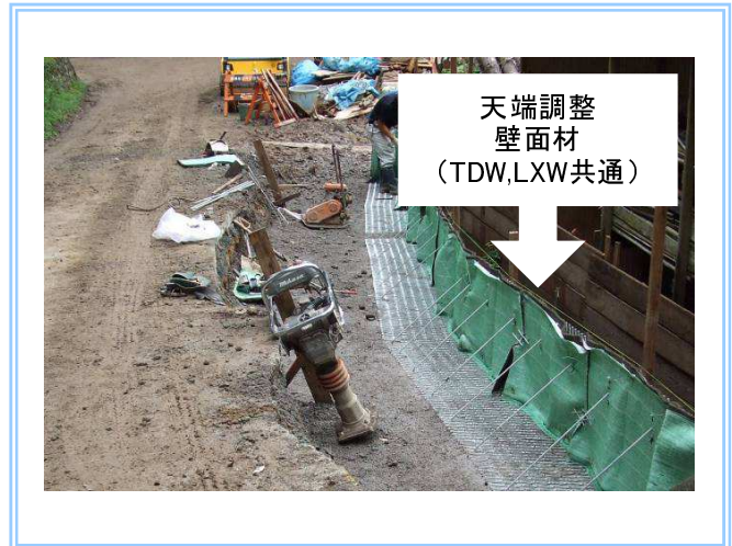
山梨県 富士川町/町道小柳川長知沢線災害復旧事業