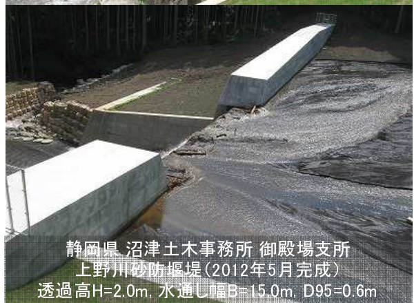
静岡県 沼津土木事務所 御殿場支所 上野川砂防堰堤 (2012年5月完成) 透過高H=2.0m, 水通し幅B=15.0m, D95=0.6m