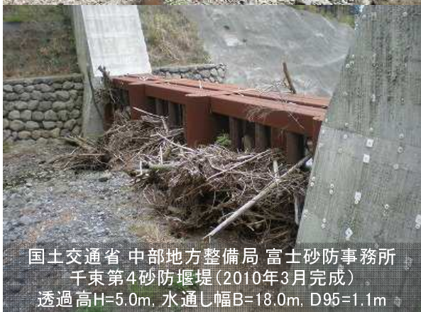
国土交通省 中部地方整備局 富士砂防事務所 千束第4砂防堰堤 (2010年3月完成) 透過高H=5.0m, 水通し幅B=18.0m, D95=1.1m