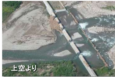
① 戸蔦別川床固工郡外流木止