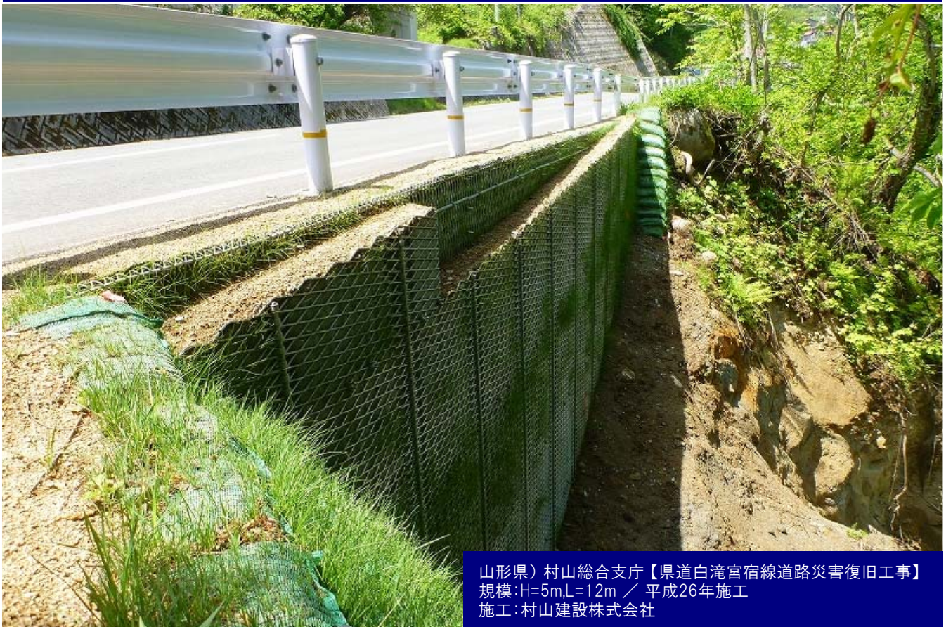
山形県) 村山総合支庁【県道白滝宮宿線道路災害復旧工事】 規模:H=5m,L=12m / 平成26年施工 施工:村山建設株式会社