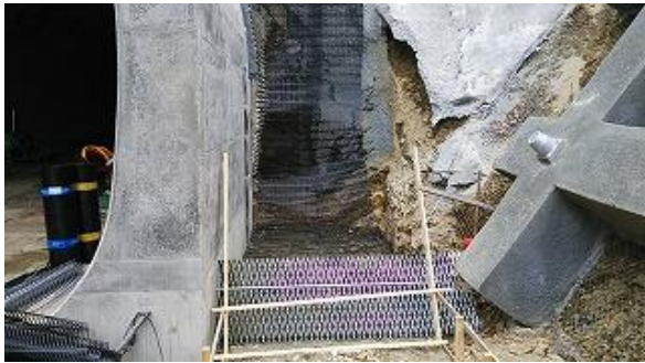
1段目 壁面材、敷き網材設置状況(外側)