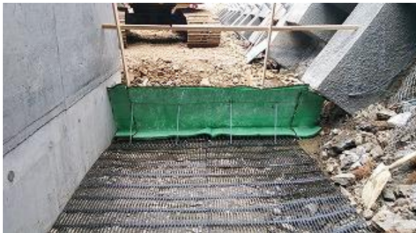
1段目 壁面材、敷き網材設置状況(内側)