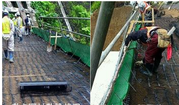
敷き網材敷設状況