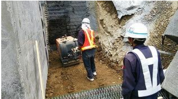
1段目 中詰転圧状況