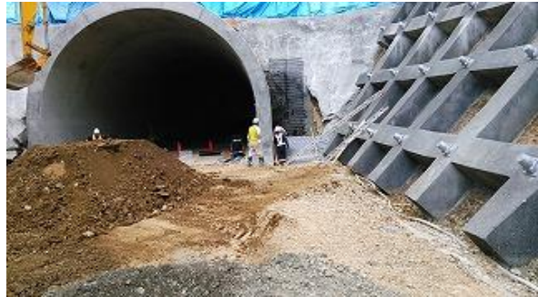
2段目 壁面材、敷き網材設置状況